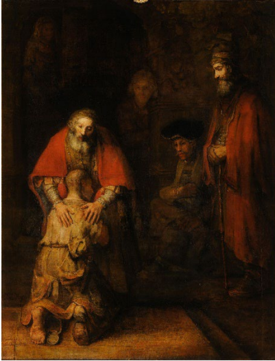
작품 1 렘브란트, 돌아온 탕자, 1661-69

그래서 우리는 그림 앞에 섭니다. 더 많이 알기 위해서만이 아니라, 때로는 위로받기 위해, 때로는 나 자신을 이해하기 위해 그리고 때로는 다시 살아갈 힘을 얻기 위해서입니다.